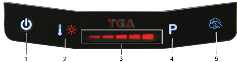
Abb 0-1 Glasbedienfeld